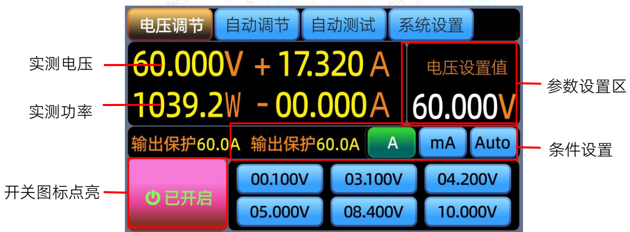
图5.5.1 电池充电饱和测试

以单节锂电池为例，设置4.000V为起始电压，终点电压为4.300V，步进为1mV,步进时间为0.1s，ASD906-48V30A500W的LCD屏开关按钮显示为蓝色，当开关按钮显示为红色是测试结束，参数显示区显示电池的充电电压值、电流值及功率值，如图5.5.1所示。