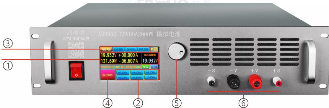
图 2.2.1 设备前面板

开关按钮(ON/OFF)用于开启或关闭模拟电池设备，红黑接线柱为模拟电池（Battery）输入和输出的电能传输接口；LCD触摸显示屏含参数设置，参数显示，菜单设置及开关等功能；调节旋钮（带触压按键）可微调电压或电流参数。操作详情见第五章。