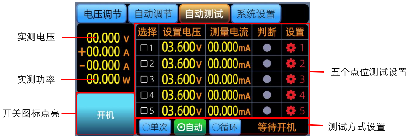
图5.6.2 电池充放电自动测试

通过完成电池自动参数单步设置，根据具体测试方法选择，这里以单次测试为例，点击LCD屏上开关按钮。启动测试，自动测试会在产品连接重新接入后开始测试，方便产品测试。循环测试，产品需要不同点位一直老化测试或是其他用到此项，可选择该项进行测试。如图5.6.2所示。