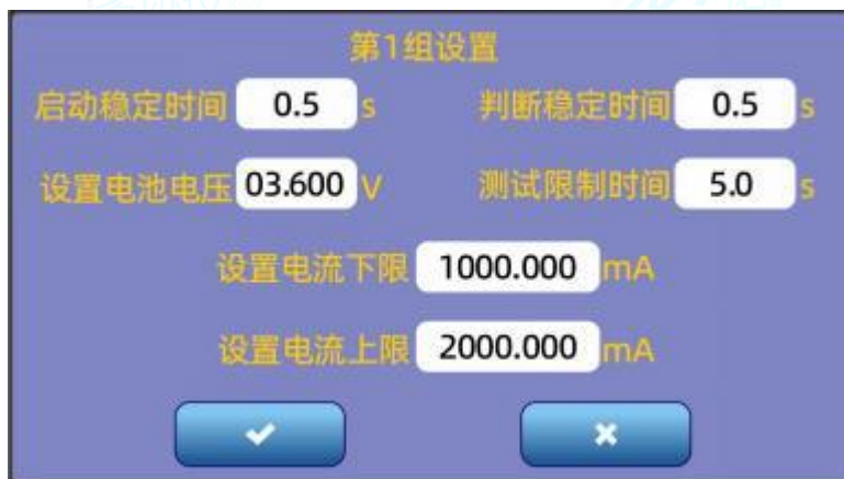
图5.6.1 电池充放电自动测试

通过点击设置栏下的设置图标键，可进行电池具体测试点设置，例如正常锂电池充电特性测试过程，启动稳定时间0.5s，判断稳定时间0.5s，设置电池电压3.6V，测试限制时间为5.0s，为具体测试时间，电池该具体测试点总共花费6.0s时间。根据具体充电电流，设置充电判断范围。